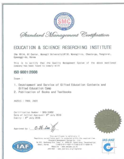
ISO 9001 국제캠프인증