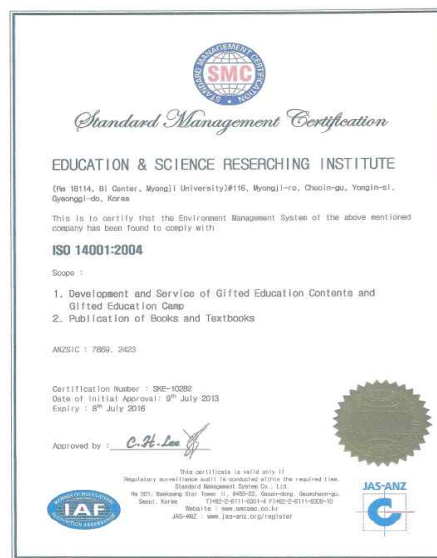
ISO 14001 국제캠프인증